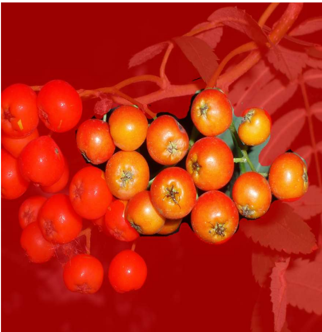
Abb. 1 Bild mit roter Maskenüberlagerung

Im Menü EXTRAS >OPTIONEN>ARBEITSBEREICH>ANZEIGE geben Sie im Feld Maskentönung eine kontrastierende Füllfarbe ein. Entscheiden Sie sich dabei möglichst für eine, die sonst im Bild nicht vorkommt und darüber hinaus einen sichtbaren Kontrast zu den vorhandenen Farben bildet (hier blau). Nach der Bestätigung des Dialogs sehen Sie die Problemzonen deutlicher. Wenn Sie die Farbüberlagerung nicht einschalten wollen, so klicken Sie in der Symbolleiste das entsprechende Icon mit dem Auge an, bzw. aus. Die Auswahl wird dann nur noch von der Maskierungslinie begrenzt (Ameisenkolonne).