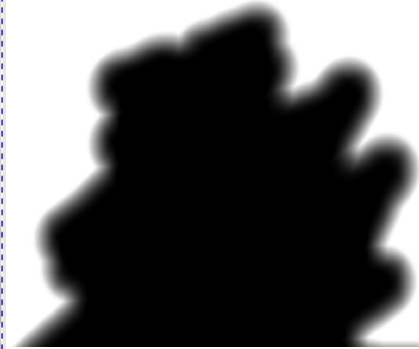
Abb. 2: Gemalte Maske