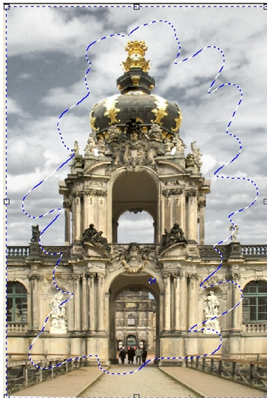
Abb. 1: Objektränder der Maske