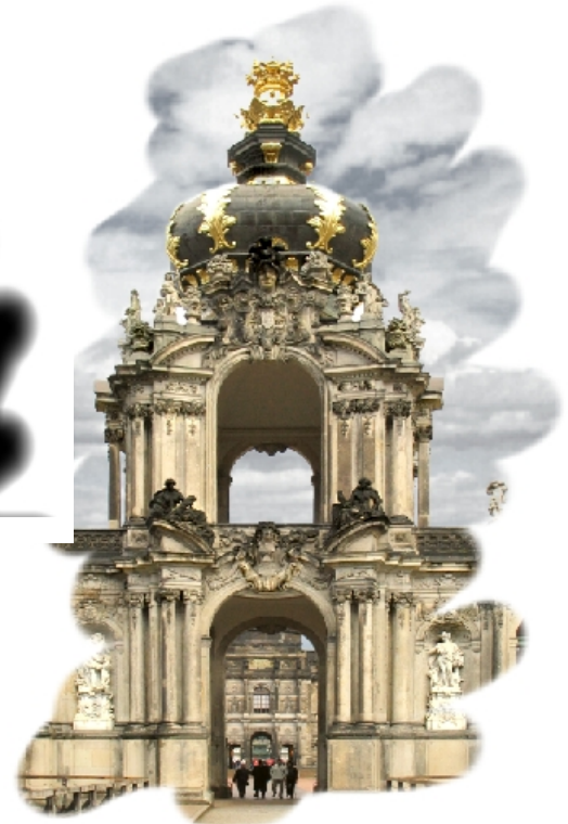
Abb. 3 Das fertige Bild mit Rahmen

Erstellen Sie aus dieser Malmaske ein Objekt. Sind die Masken- und Objektrahmen eingeschaltet, so zeigen sich nach der Zuweisung blaue Ameisenkollonnen an den Objekträndern.